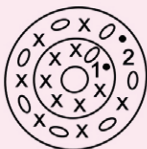
Gráfico del ojo

Remata y deja un trozo de hilo para coser las patas al cuerpo. No pongas relleno.